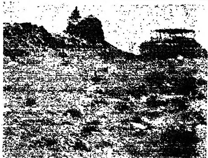
موقع جديد للعدو بين « البيستان » و « مروحين »

واضاف : ازاء هذه الحالة نحل المسؤولون نية مودنا السي الاضراب وتشريد نصف يلبسون طلب في اواخر السنة الدراسية ، لان المعلمين صبروا طويلا على هذا المشروع القائم في مجلس الوزراء .